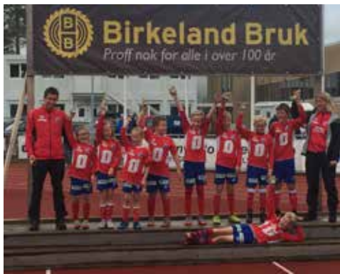
Gutter 10 lag 2