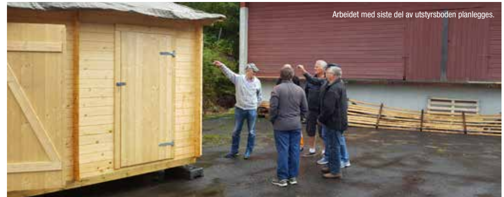
Arbeidet med siste del av utstyrsboden planlegges.