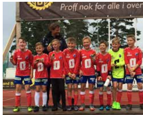
Gutter 11 lag 1