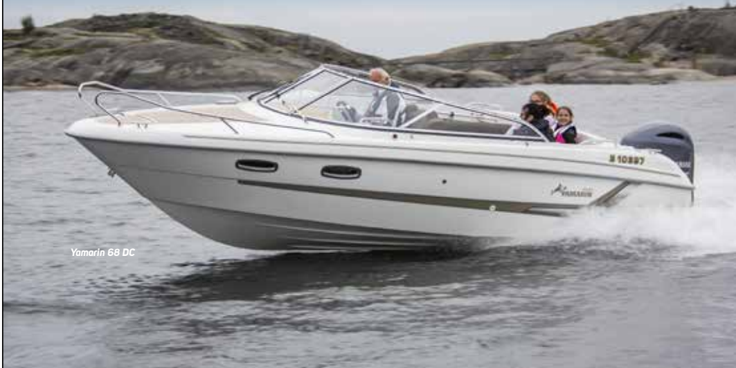
Yamarin 68 DC

– Din totalleverandør av tjenester innenfor båt og sjøliv.