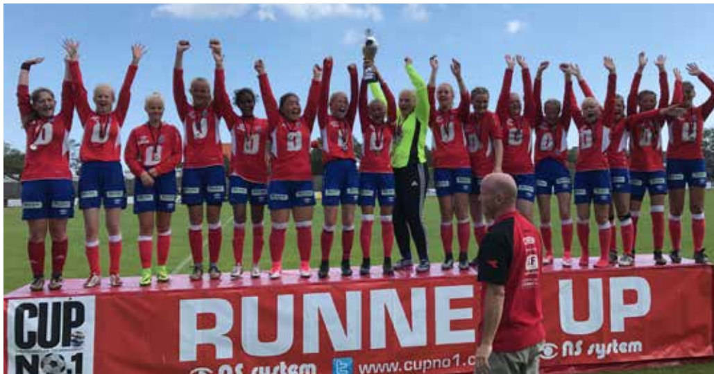
J16 - sølv i Cup No 1 2017!